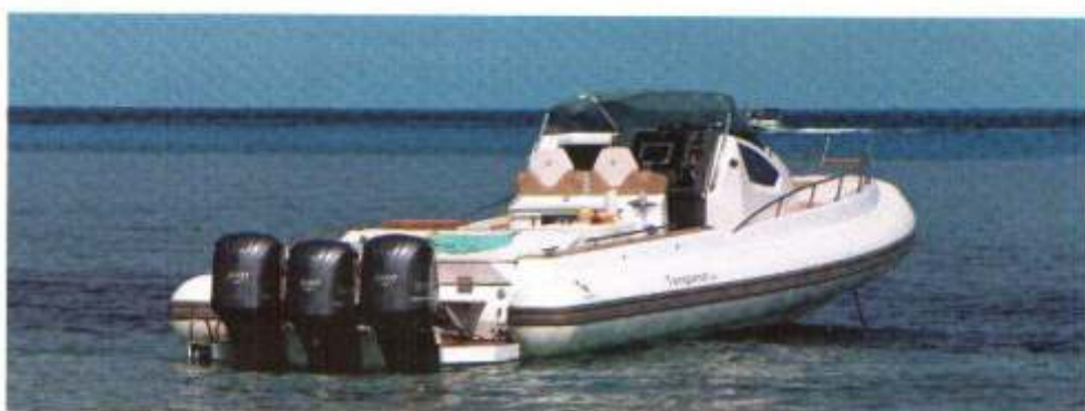
Com uma motorização máxima que pode atingir os 1.050 cavalos, o Tempest 44 é uma máquina de velocidade.

50l e um microondas. O ambiente está dividido da casa de banho com WC elétrico, duche com box em plexiglass e lavatório. Na cabine a decoração é um elemento essencial e a opção da pele (Luxury Pack) torna-a ainda mais acolhedora. A marca Italiana conseguiu aproveitar a profundidade do casco para uma altura máxima de 1,95m na cabine e uma distribuição muito funcional dos espaços.